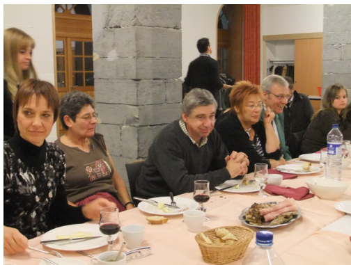
Sainte Cécile (2010)

Puis vers la fin de la guerre, il faut cacher les instruments, notamment les cuivres : c'est chose faite dans le foin d'une grange voisine... Enfin, après une petite reprise