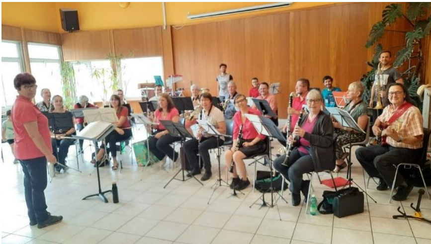
Orchestre Départemental des Hautes-Alpes