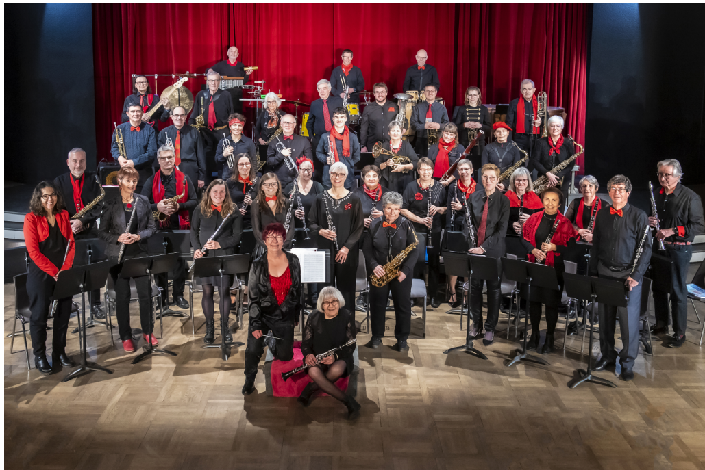
La Musique Municipale d'Embrun (concert du Nouvel An, 2024)