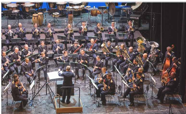
Musique de la Marine Nationale

Le Big Band donnera un concert sur le thème Cap Nougaro le 25 mai 2024, à 21H, au gymnase du Plan d'Eau.