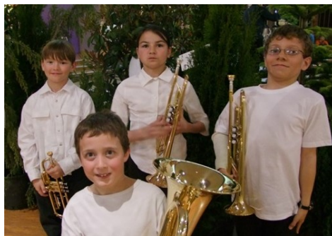
Musique à l'école (2006)

Pendant les défilés, les tambours en première ligne donnent le pas. Le chef, à l'avant, guide les rangs. Lors des fêtes d'août, 4 tambours s'étaient mis d'accord pour défiler dans différentes ruelles à la fin de la prestation. Débandade dans les rangs, les 4 tambours prennent 4 rues différentes sans en avoir averti les chefs. Les musiciens suiveurs ne savaient plus où aller... et ne parlons pas de la difficulté à retrouver tous les musiciens dans le flot de touristes... un mauvais souvenir pour le chef d'orchestre, mais un super souvenir pour les musiciens.