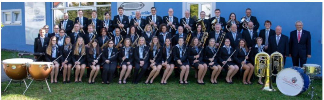
Stadtmusik Zell im Wiesental