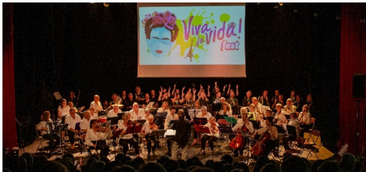
Harmo'Dye, orchestre du Diois