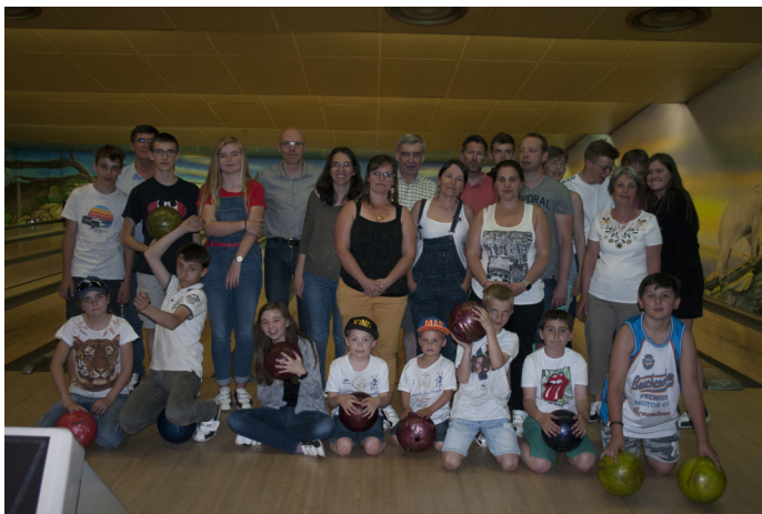
La Musique au bowling (2019)