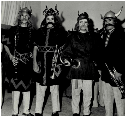
Musiciens gaulois (1967)

Dès 1907, ce sont les pompiers qui animent la fête patronale. La guerre met ensuite en sommeil les activités festives. En 1920-1921, pour les fêtes officielles, il faut faire appel à des formations d'origines diverses : les Boys Scouts et leur "clique", la musique des Sapeurs-