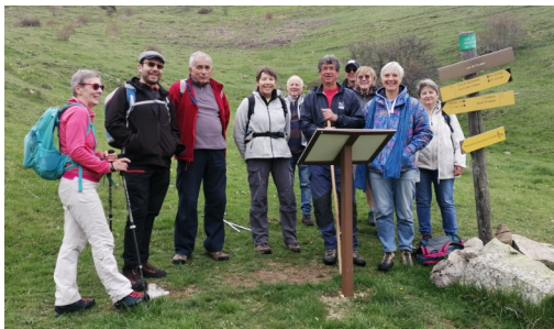
Randonnée pédestre à la Croix Philippe (2023)

Pompiers de Gap, la Lyre des Alpes de Guillestre.