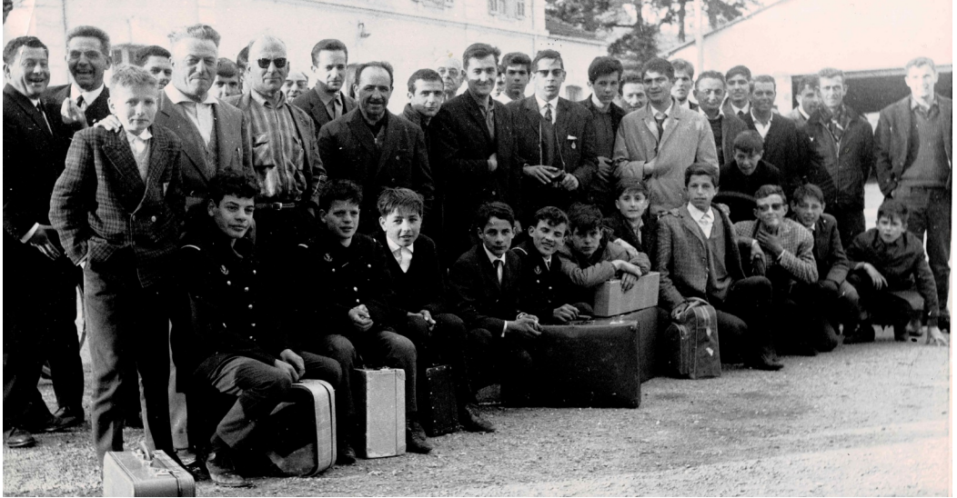
La Musique en Corse (1963)

qui se succédèrent, tout en conférant quelque peu de mystère à ce comportement anormal de l'instrument. Sans aucun doute, le clairon était obstrué. Par qui ? Par quoi ?