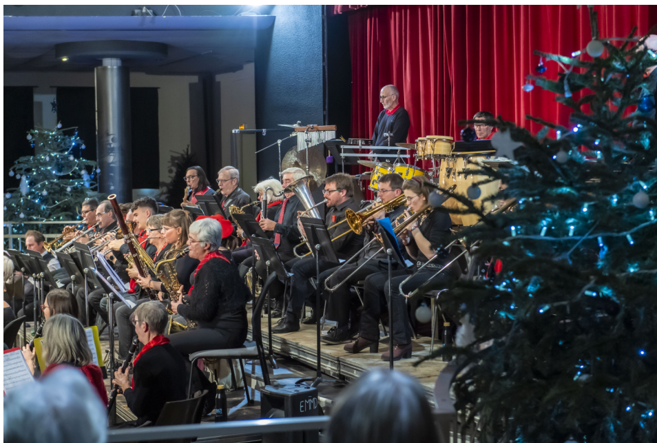
Musique Municipale d'Embrun (concert du Nouvel An, 2024)