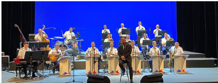
Big Band Jazz de la Marine Nationale