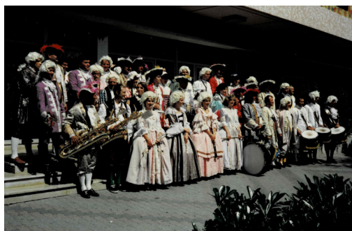
La monarchie défile (1991)

donne un concert nocturne à l'espace Delaroché. Les musiciens sont déguisés en Louis XVI et Marie-Antoinette, perruques incluses. Un orage s'abat sur la ville... Eux qui se plaignaient du poids des costumes avant même de jouer n'avaient encore rien vu ! Le concert s'arrête net et les musiciens courent se mettre à l'abri, trempés jusqu'aux os, et tellement lourds.