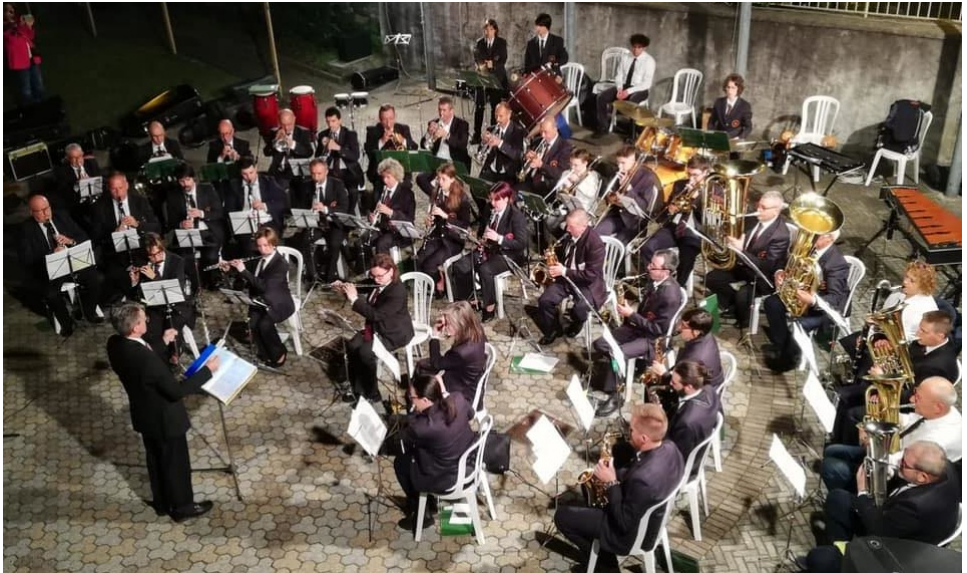
Filarmonica di Borgofranco d'Ivrea