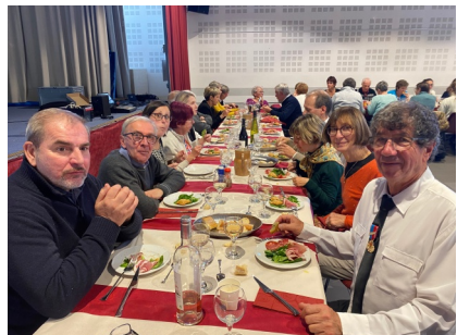
Repas de la Sainte-Cécile (2023)