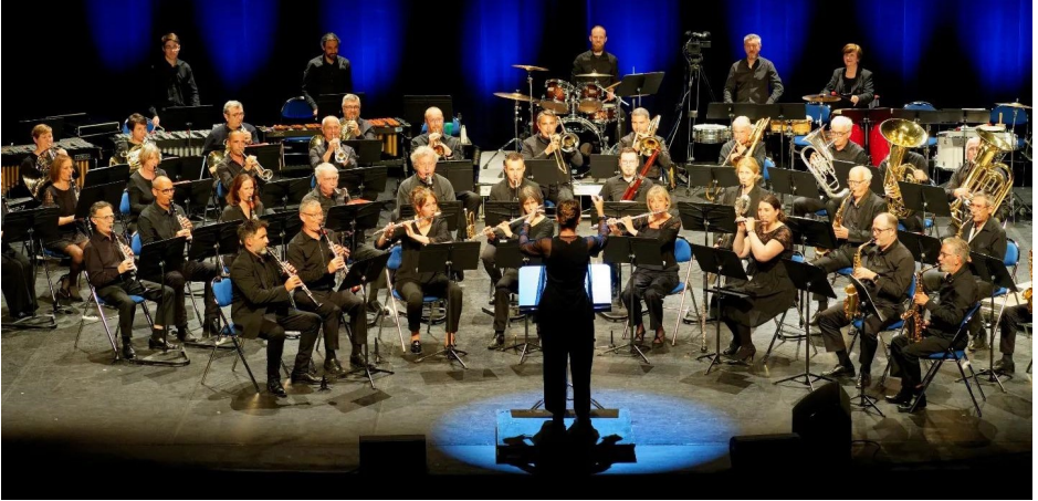
Les Philharmonistes des pays de Vaucluse