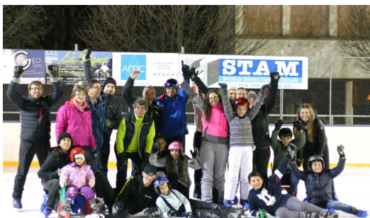
La Musique à la patinoire (2019)