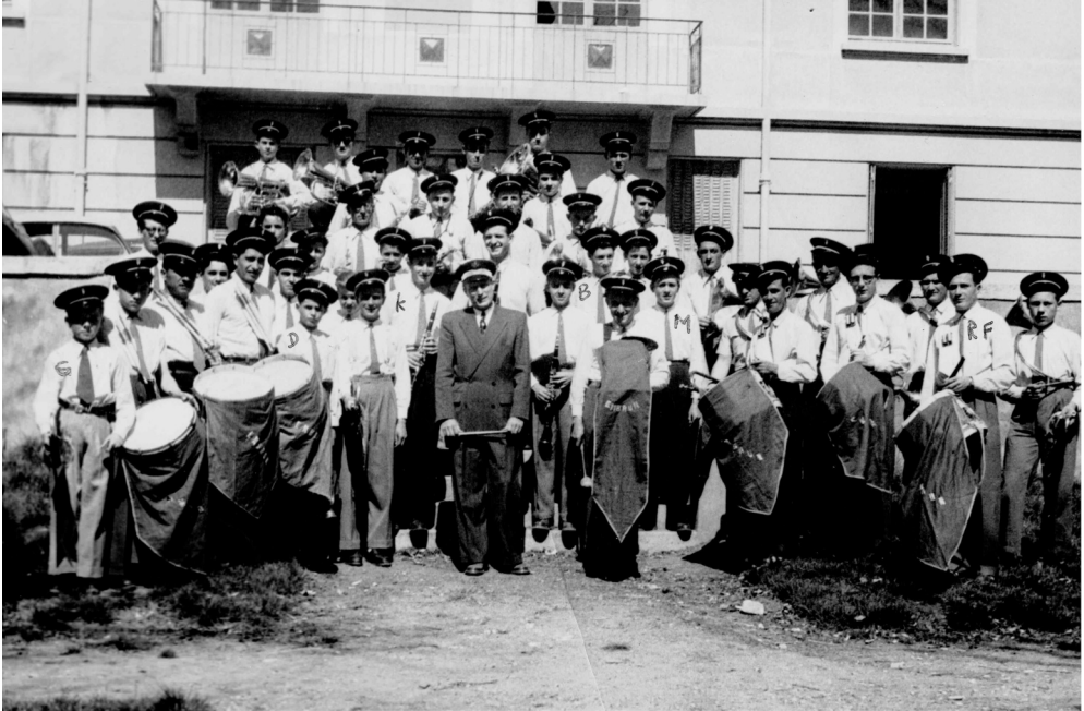
Musique d'Embrun (1952)