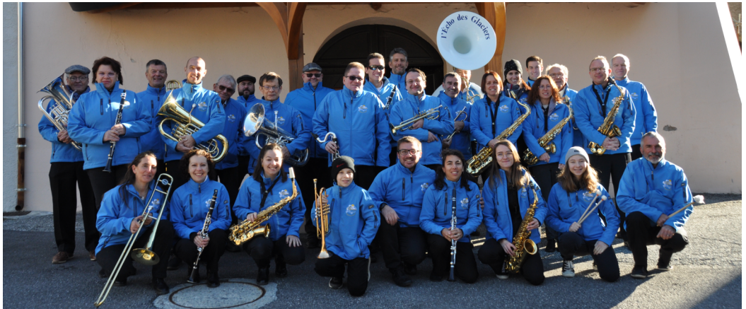
L'Écho des Glaciers